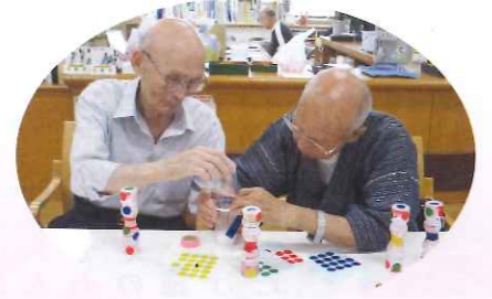
デイサービス (マラカス作り)