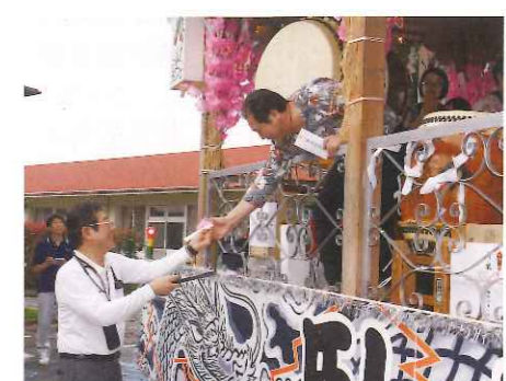
▲ 寒河江まつり「臥龍太鼓」慰問