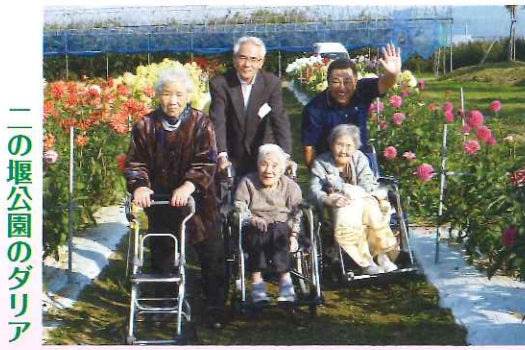
二の堰公園のダリア