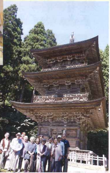
慈恩寺御開帳見学