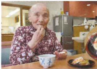
お茶を飲みながら ぼたぼた焼を いただきました。