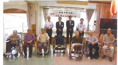
山形日産自動車(株)寒河江店様より 車いす1台寄贈いただきました。