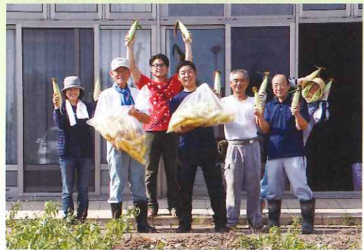
トウモロコシ収穫