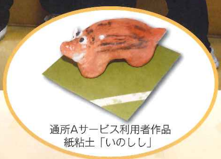
通所Aサービス利用者作品 紙粘土「いのしし」

◆発行所 社会福祉法人 松 寿 会 〒991-0063 寒河江市大字柴橋2246-1