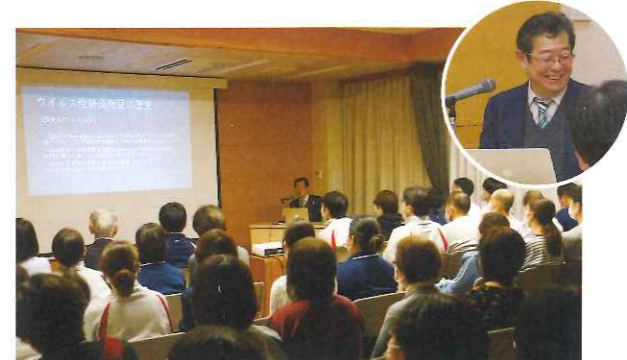
▲ 理事長講話は「肝炎について」