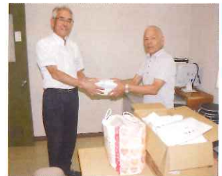
県退職公務員連盟西村山支部 寒河江地区会様より タオル80枚寄贈