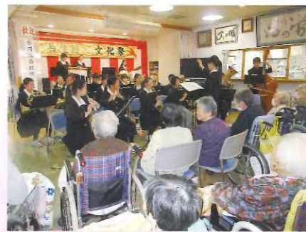
文化祭 寒河江高校吹奏楽部様