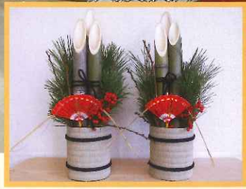
「門松」 ボーイスカウト山形県連盟寒河江第1回様より