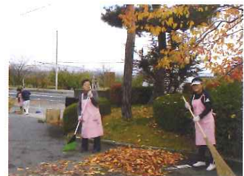
商工会女性部様 落ち葉掃きボランティア

今年度は平成最後の年、 今年度新しくなる元号は どんな名称になるのでしょうか、 楽しみです。 千支も十二支最後の『亥』年で す。亥は猪突猛進、目標に向かっ てまっしぐらに突進して行く、そ んな勢いのある年にしていきたい ものです。