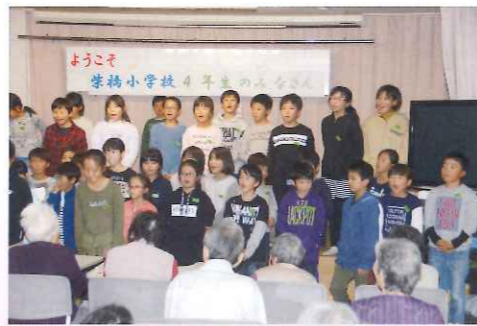
柴橋小学校4年生との触れ合い