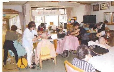
寒河江理美容組合様慰問