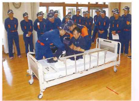
消防団との防災・消防訓練