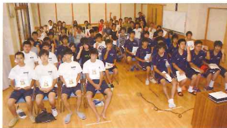
寒河江工業高校南地区PTA様 清掃ボランティア/認知症サポーター養成講座